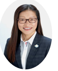
さいたま市議会議員